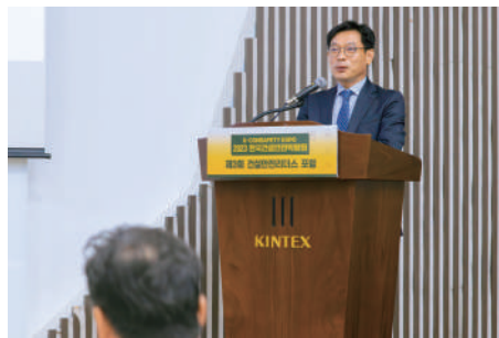
고용노동부 류경희 본부장 강연