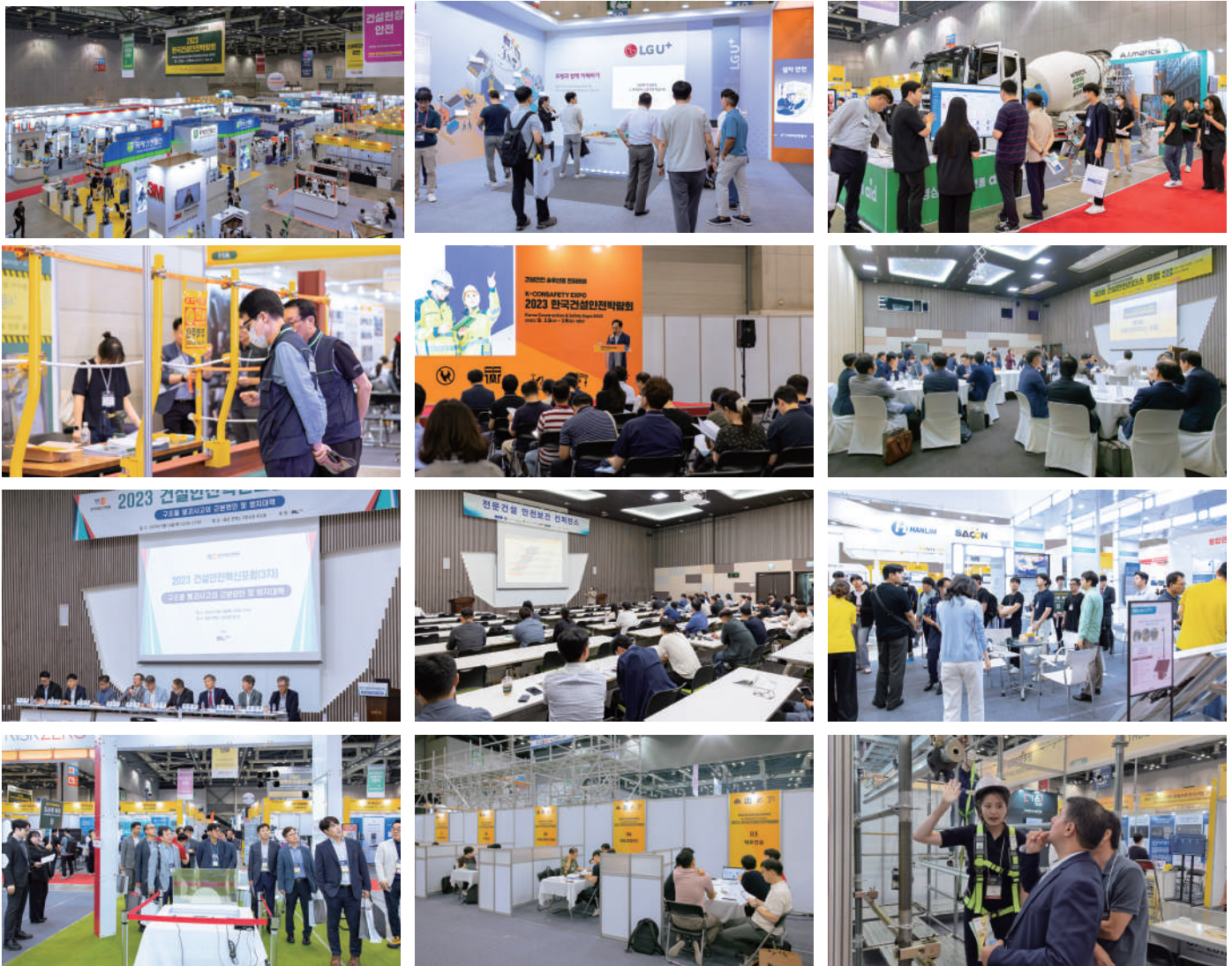
건설안전리더스포럼, 도슨트투어, 오픈세미나, CSMA구매상담회, KOTRA수출상담회, 각종 컨퍼런스 및 세미나 등