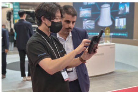
KOTRA 해외바이어 수출상담회