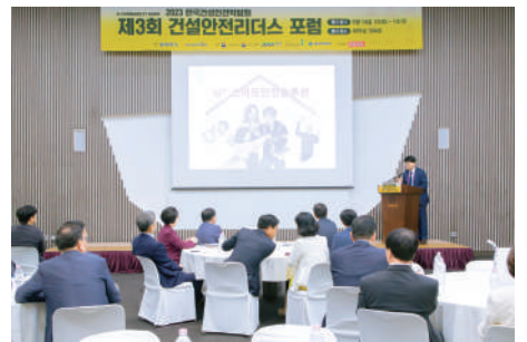
LG유플러스 첨단기술 발표